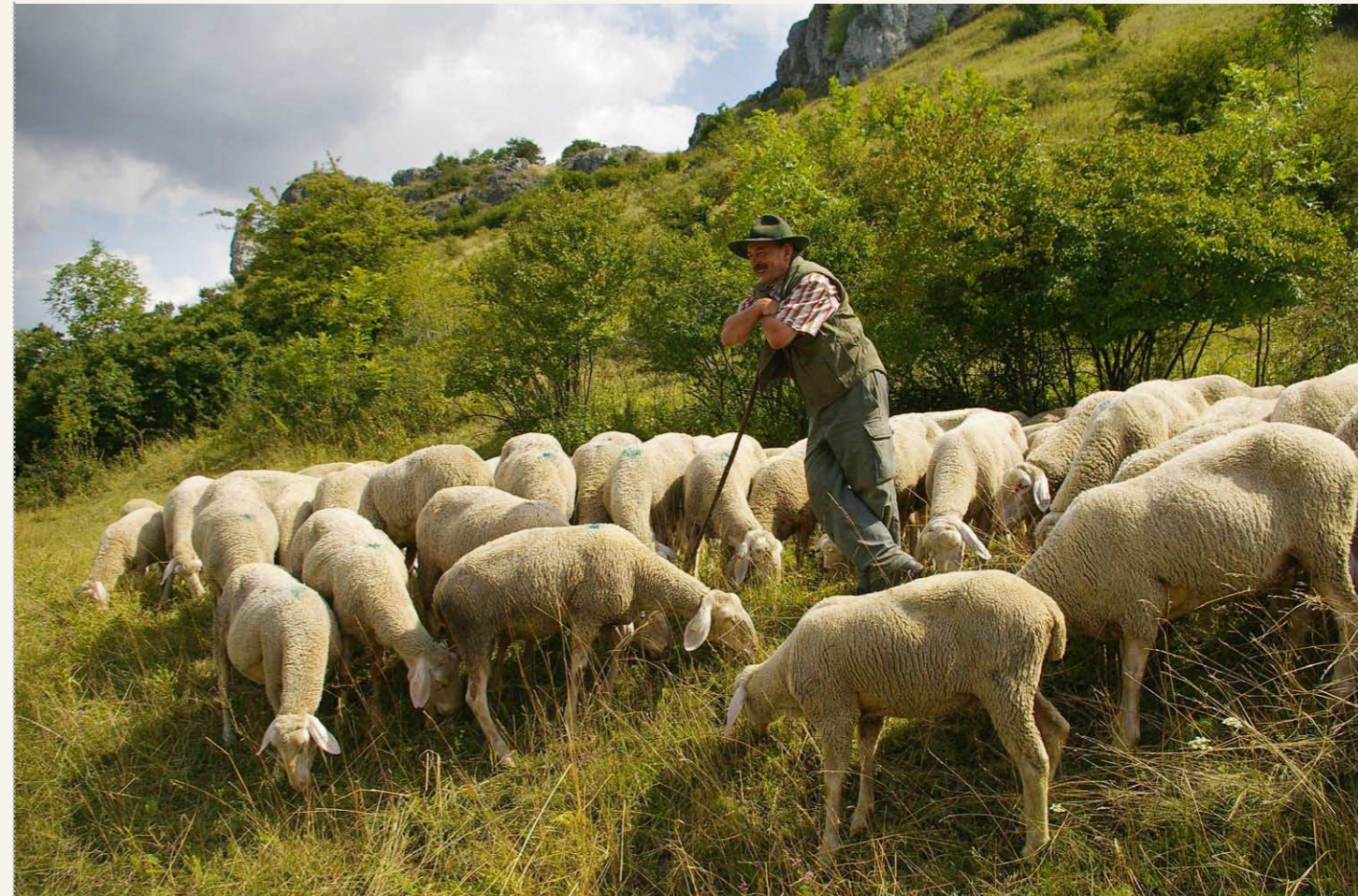
Die Hänge des Walberlas gehören zu den Weideflächen des Juralammes.